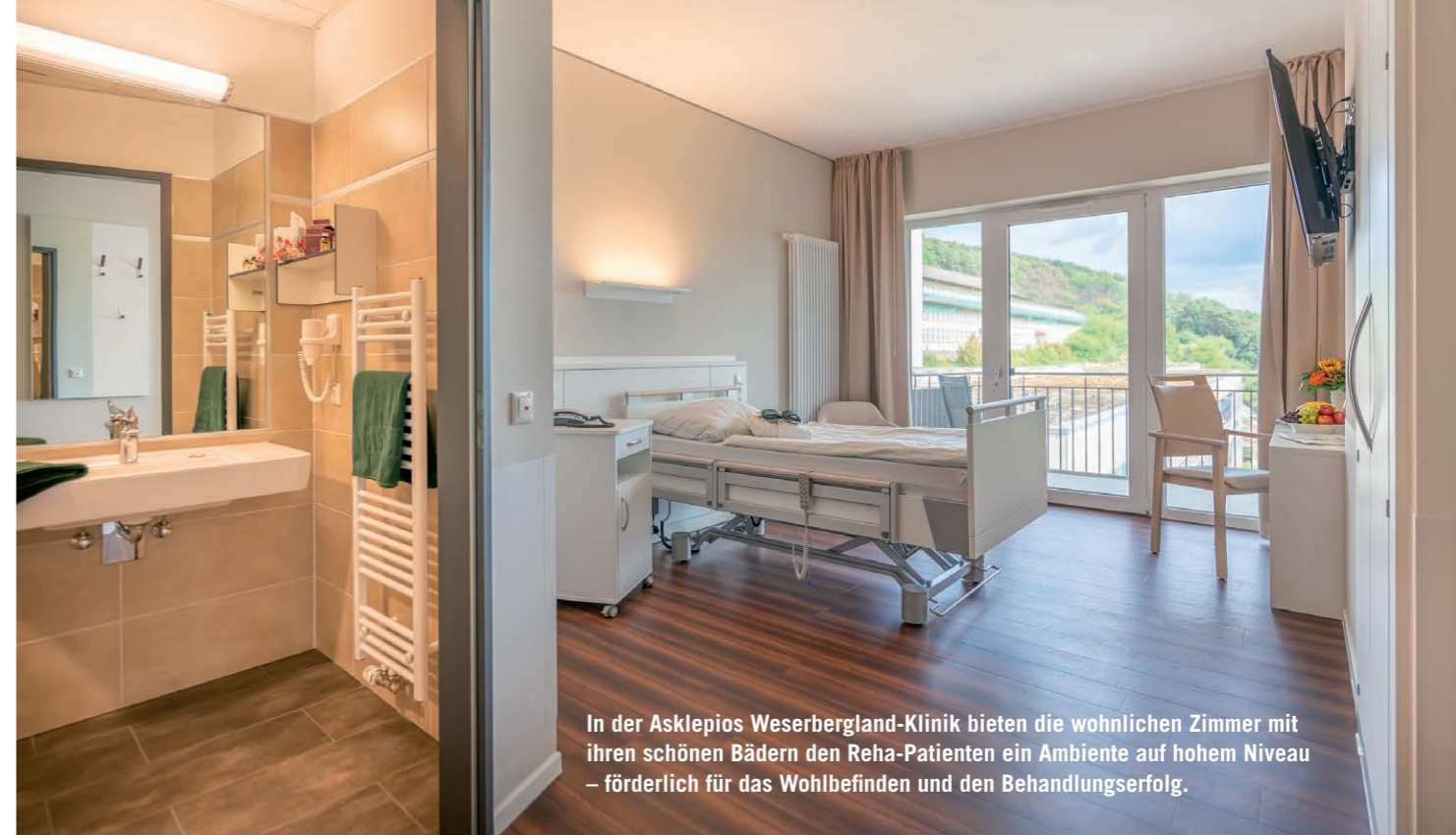
In der Asklepios Weserbergland-Klinik bieten die wohnlichen Zimmer mit ihren schönen Bädern den Reha-Patienten ein Ambiente auf hohem Niveau – förderlich für das Wohlbefinden und den Behandlungserfolg.