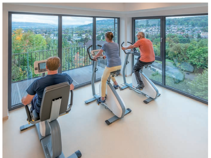
Medizinische Trainingstherapie mit traumhaftem Ausblick über Höxter und das idyllische Wesertal.