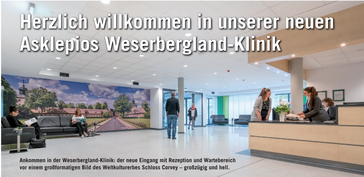
Ankommen in der Weserbergland-Klinik: der neue Eingang mit Rezeption und Wartebereich vor einem großformatigen Bild des Weltkulturerbes Schloss Corvey – großzügig und hell.