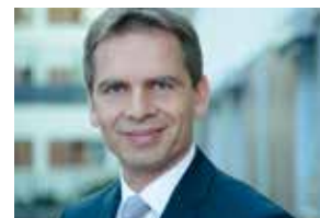
Мартин фон Хуммель